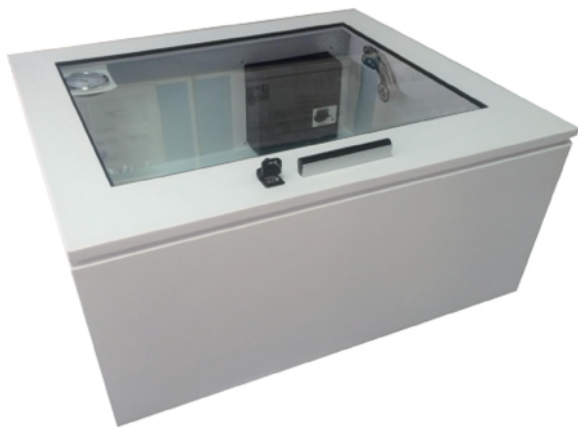
红外电子防潮箱(选配)